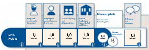
Ergebnis der aktuellen MDK-Prüfung

Hügelweg 37, 46562 Voerde · Tel.: 0281/3192-0 · Fax: 0281/3192-500 sz@awo-kr-west.de · www.awo-kr-west.de